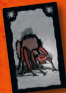
Spinne Spider Araignée Ragno