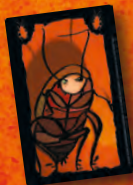
Kakerlake Cockroach Coquerelle Scarafaggio