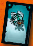
Fliege Fly Mouche Mosca